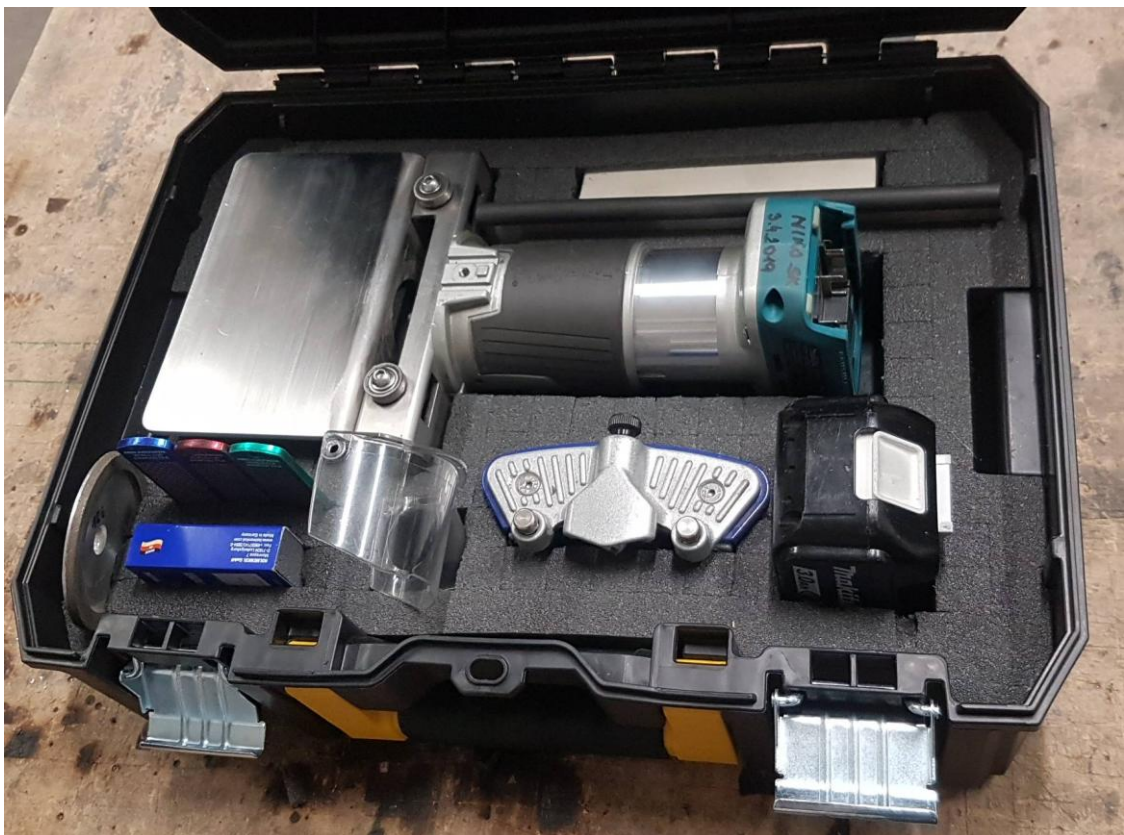
Batériová verzia v kufríku (+40€ za kufrík) s príslušenstvom (nie je v cene ale dá sa objednať)