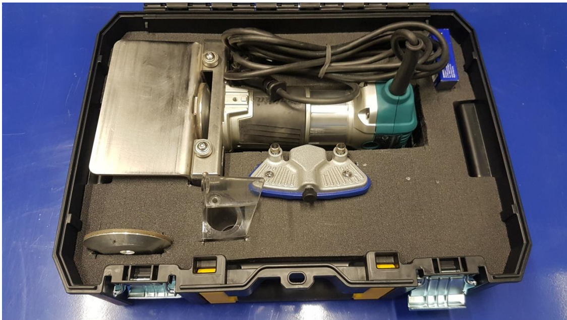
Káblová verzia v kufríku (+40€ za kufrík) s príslušenstvom (nie je v cene ale dá sa objednať)

Doplatok platí pri oboch brúskach v kompletnej konfigurácii s pohonnými jednotkami